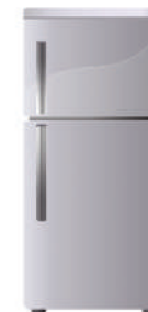
Lodówki i zamrażarki

* Piekarnik, czajnik, kuchenka mikrofalowa, ekspres do kawy.