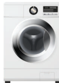
Zmywarki i pralki