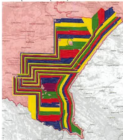
Zasięg dodatkowej akcji doustnych szczepień lisów wolno żyjących w woj. podkarpackim w 2024 r.

Dodatkowo wyłożono ręcznie 14 000 dawek w części powiatów województwa: 7 000 dawek w powiatach: brzozowskim, jarosławskim, leskim, lubaczowskim, przemyskim, sanockim i bieszczadzkim oraz 7 000 dawek w strefie przygranicznej ADIZ, gdzie nie mogą operować samoloty, w powiatach przygranicznych, tj. lubaczowskim, jarosławskim, przemyskim i bieszczadzkim, we współpracy z Bieszczadzkim Oddziałem Straży Granicznej w terenie przygranicznym.